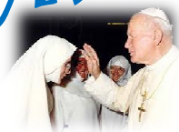
św. Jan Paweł II, Przeżycie z okazji 750. Rocznicy śmierci św. Klary

Jest moim najgorętszym życzeniem, wspartym modlitwą, aby wasze klasztory, odpowiadając na powszechną we współczesnym Świecie potrzebę duchowości i modlitwy, nadal proponowały trudną drogę pełnego i autentycznego doświadczenia Boga w Trójcy Świętej Jedynej, które byłoby promieniowaniem Jego obecności, niosącej miłość i zbawienie.