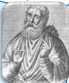
Justyn Męczennik – święty, filozof i najstarszy pisarz chrześcijański (ur. ok. 100 r. zm. ok. 165 r.)

„A ten pokarm nazywa się u nas Eucharystią; nikomu nie wolno brać w nim udziału, tylko temu kto wierzy, że Prawdą jest to czego uczymy, i kto został obmyty ową wodą na odpuszczenie grzechów i na odrodzenie, i kto żyje tak jak Chrystus przykazał. Bo my tego nie pożywamy, tak jak się je pospolity chleb i pije pospolity napój, lecz nauczono nas, że jak Jezus Chrystus Zbawiciel nasz, przez Słowo Boże stawszy się człowiekiem, miał Ciało i Krew dla naszego zbawienia, tak też i ów Pokarm nad którym przez modlitwę zawierającą Jego Słowa, odprawiono dziękczynienie, a którym przez przemianę krew i ciało nasze odżywia się – jest Ciałem i Krwią tegoż Jezusa, który się wcielił.”