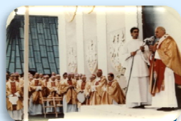
św. Jan Paweł II

„Każde powołanie kapłańskie w swej najgłębszej warstwie jest wielką Tajemnicą, jest Darem, który nieskończenie przerasta człowieka. Każdy z nas, kapłanów, doświadcza tego bardzo wyraźnie w całym swoim życiu. Wobec wielkości tego Daru czujemy, jak bardzo do niego nie dorastamy.”