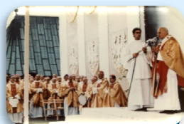
św. Jan Paweł II

„Każde powołanie kapłańskie w swej najgłębszej warstwie jest wielką Tajemnicą, jest Darem, który nieskończenie przerasta człowieka. Każdy z nas, kapłanów, doświadcza tego bardzo wyraźnie w całym swoim życiu. Wobec wielkości tego Daru czujemy, jak bardzo do niego nie dorastamy.”