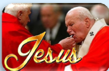
Ecclesia de Eucharistia, 17 kwietnia 2003 r.