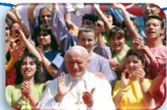
Przemówienie do młodzieży włoskiej, 8 listopada 1978 r.

„Kościół otrzymał Eucharystię od Chrystusa, swojego Pana, nie jako jeden z wielu cennych darów, ale jako dar największy, ponieważ jest to dar z samego siebie, z własnej osoby w jej świętym człowieczeństwie, jak też dar Jego dzieła zbawienia”.