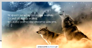
W moim wnętrzu toczy się walka. To jest straszna walka, toczona pomiędzy dwoma wilkami. [...]

– W moim wnętrzu toczy się walka. To jest straszna walka, toczona pomiędzy dwoma wilkami. Starzec zrobił pauzę, by zacerpnąć tchu, lecz po chwili kontynuował z poważną miną: – Jeden z wilków jest zły. On jest gniewem, zazdrością, smutkiem, żalem, chciwością, pychą, użalaniem się nad sobą, poczuciem winy i niższości, kłamstwem, fałszywą dumą, pragnieniem dominacji i ego. – Drugi wilk jest dobry – starzec rozpromienił się. – On jest radością, pokojem, miłością, nadzieją, pokorą, uprzejmością, dobrocią, hojnością, prawdą, współczuciem i wiarą. – Taka sama walka toczy się w tobie – podsumował starzec – i wewnątrz każdego innego człowieka. Wnuk zastanowił się przez chwilę, a potem zapytał dziadka: – Który wilk wygra? – Ten, którego nakarmisz – padła odpowiedź.”