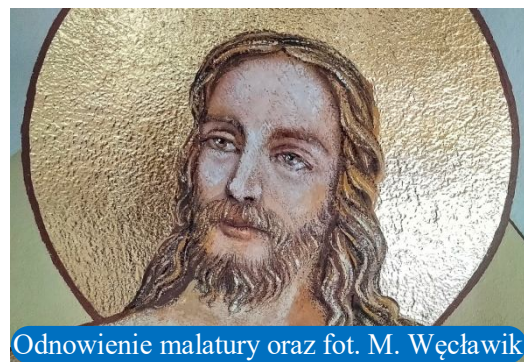
Odnowienie malatury oraz fot. M. Węclawik

NIECH BÓG PRZYJMIE OFIARY NA SWOJĄ CHWAŁĘ I ZBAWIENIE WSZYSTKICH DARCYŃCÓW